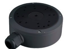
PR-JB14IP66-G Anschlussdose wetterfest, grau