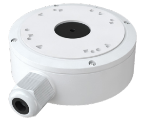
PR-JB14IP66 Anschlussdose wetterfest